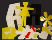
découpes en plexiglass