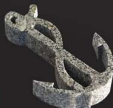
granit, épaisseur: 50mm