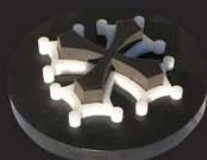
inclusion en Ertalon®