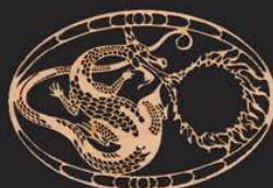
décoration en bois épaisseur: 20mm