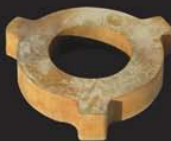
acier, épaisseur: 60mm