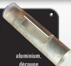
aluminium, découpe dans un tube