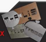
"puzzle" : inox, laiton, cuivre et bronze