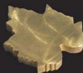
bronze, épaisseur: 15mm